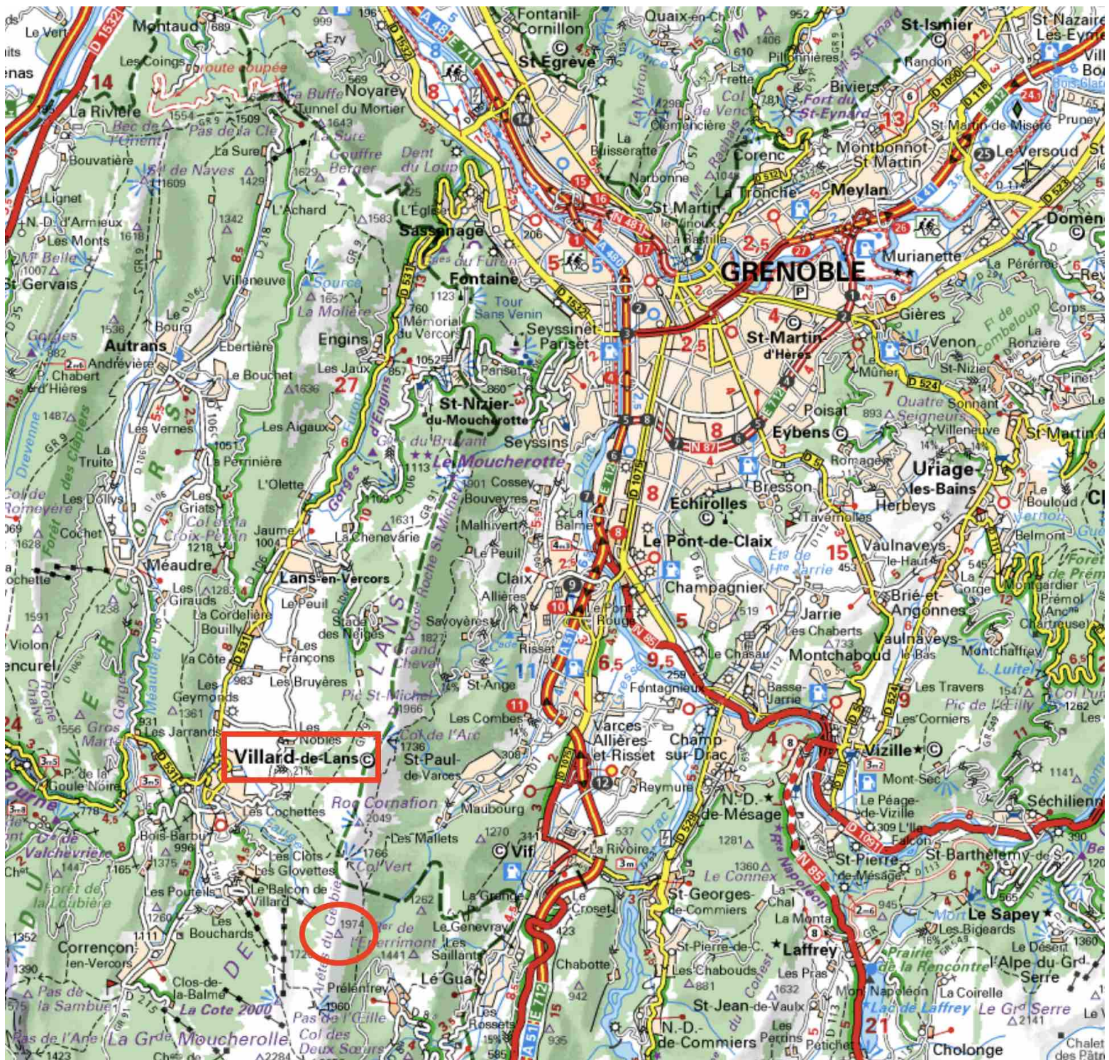
De Grenoble à Villard-de-Lans (ViaMichelin)