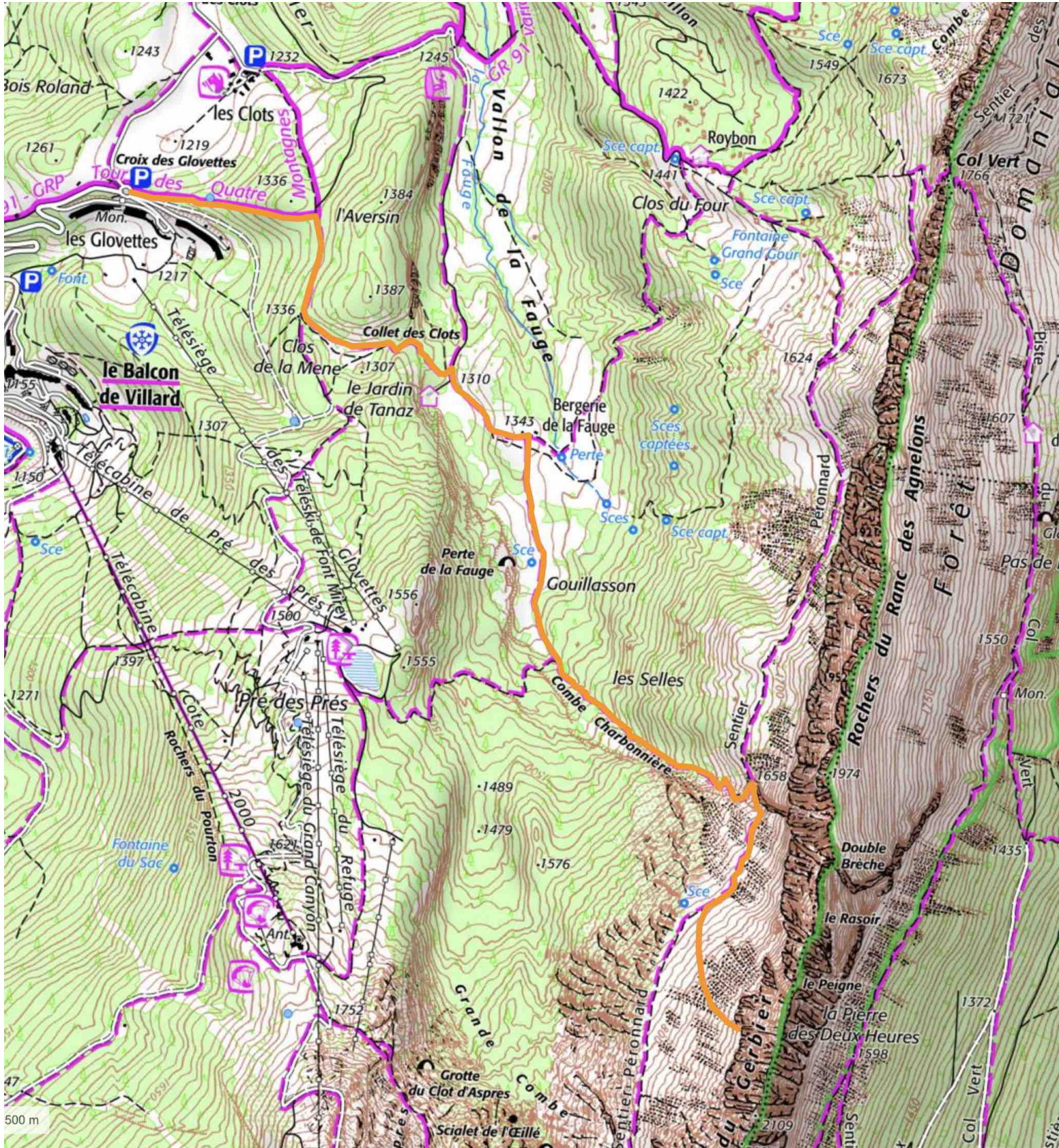
Approche sur sentier depuis la Croix des Glovettes (en orange) (IGN - Géoportail)