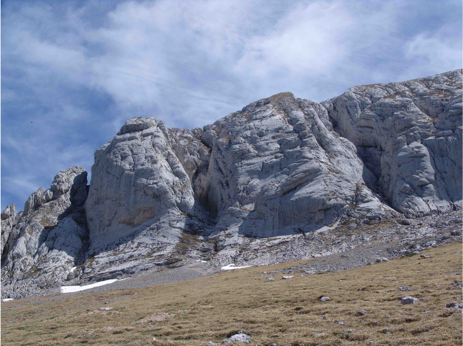
Arête du Gerbier, Face W – Le Pilier Jonot-Martin et le Pilier des Marmottes (Photo prise le 26 mai 2006)