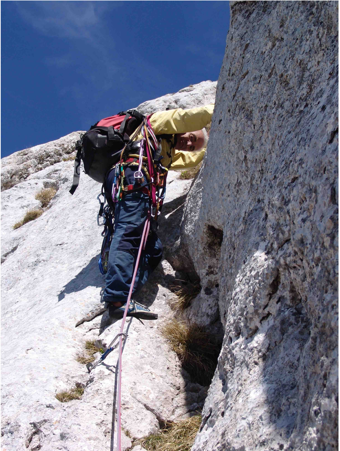
Arête du Gerbier, Face W – Pilier des Marmottes – Court dièdre au début de L3 (Photo prise le 26 mai 2006)