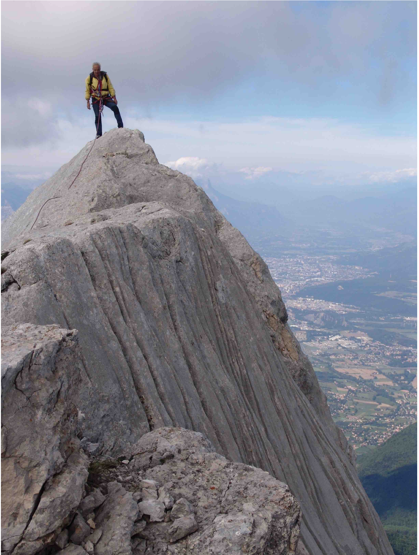
Arête du Gerbier, Face W – Pilier des Marmottes – Passage photogénique sur l'arête lors du retour par le S (Photo prise le 26 mai 2006)