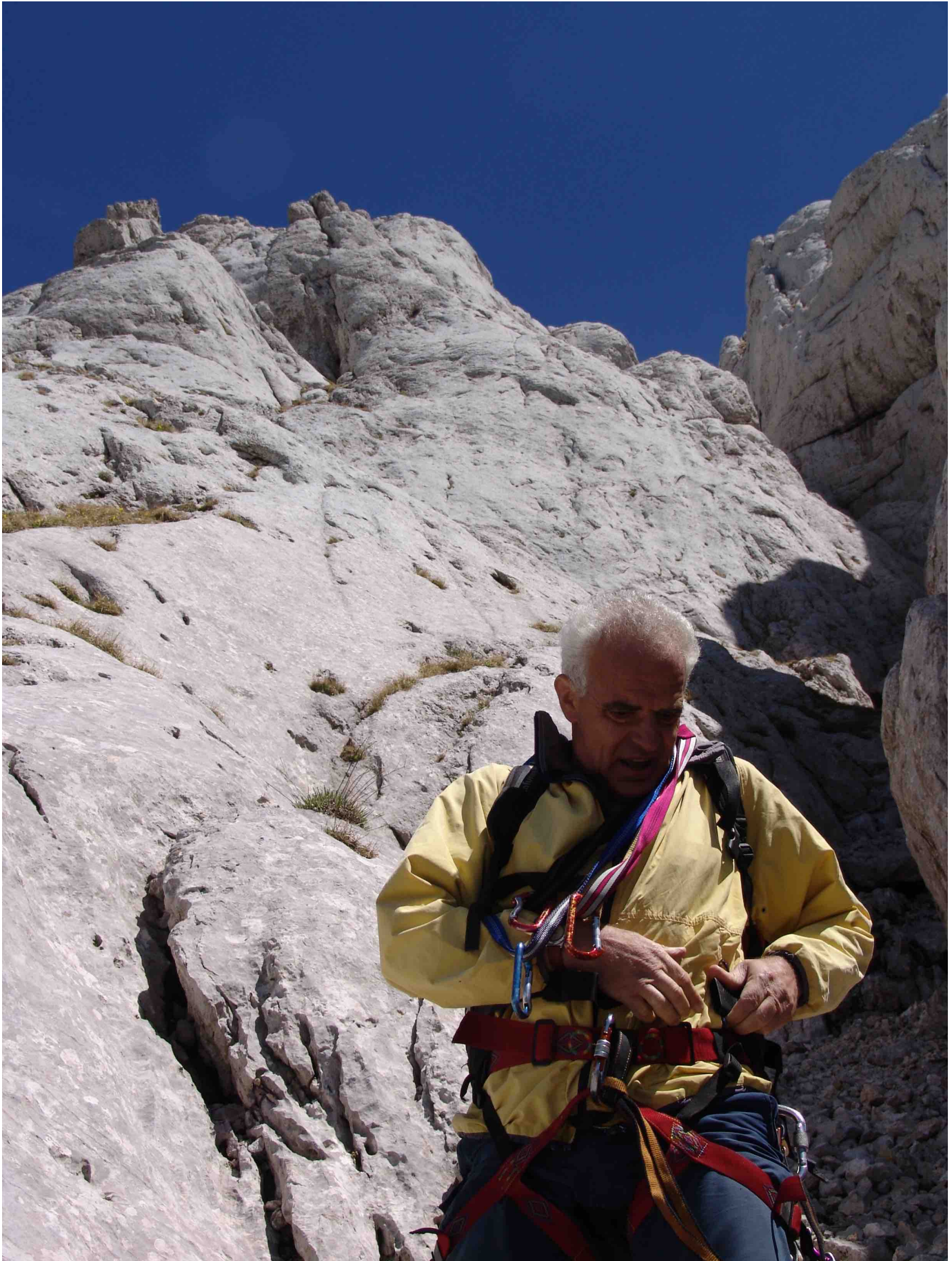
Arête du Gerbier, Face W – Pilier des Marmottes – La cheminée en V vue depuis le départ de la voie (Photo prise le 26 mai 2006)