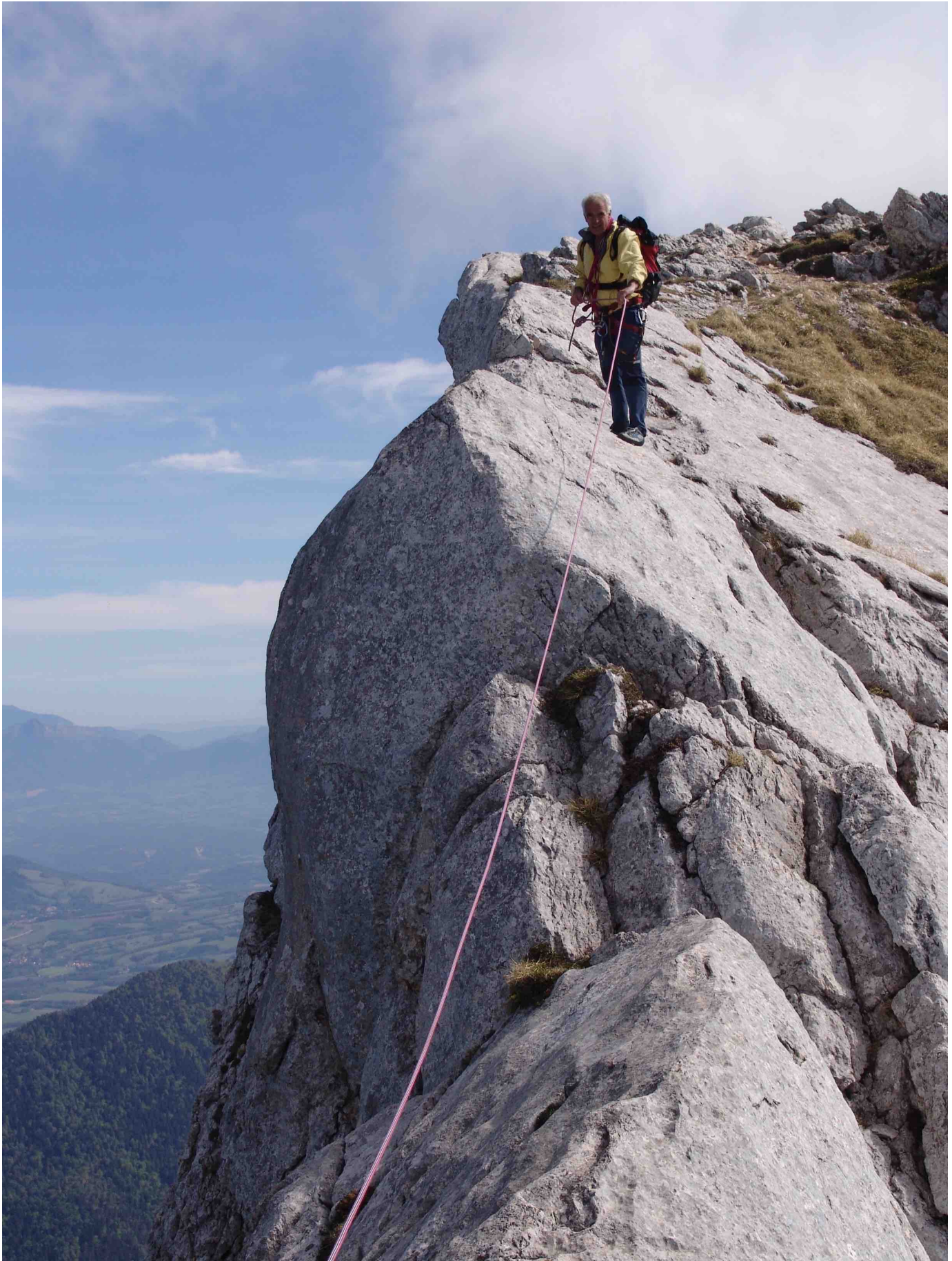
Arête du Gerbier, Face W – Pilier des Marmottes – Probablement l'arrivée au R5 (Photo prise le 26 mai 2006)