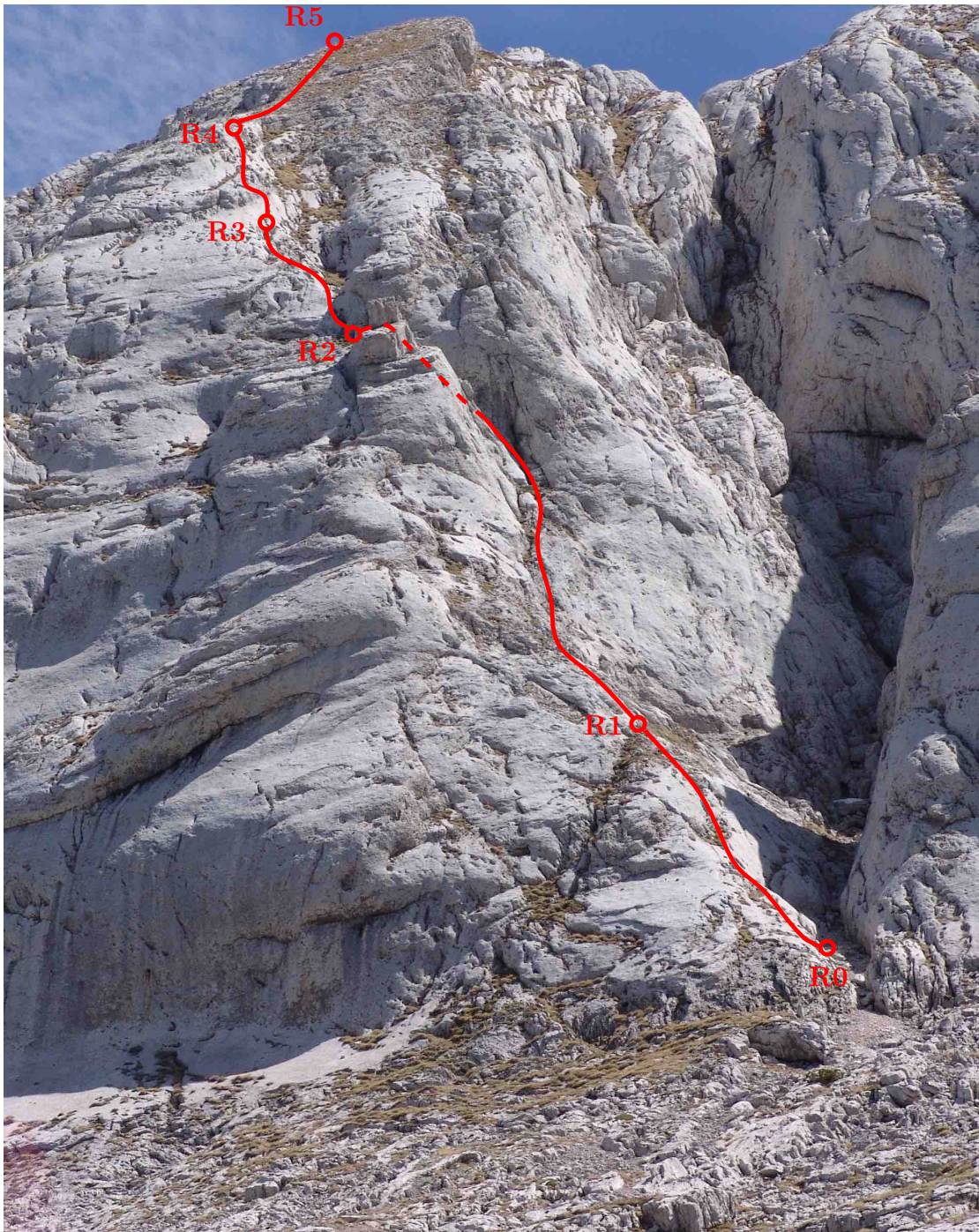
Arête du Gerbier, Face W – Pilier des Marmottes – Topo (Photo prise le 26 mai 2006)