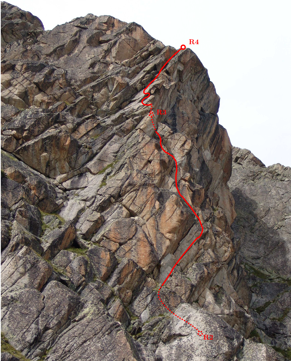
Site de l'Ancienne Cabane d'Orny, Petite Fleur (deuxième partie) (photo prise le 14 août 2008)